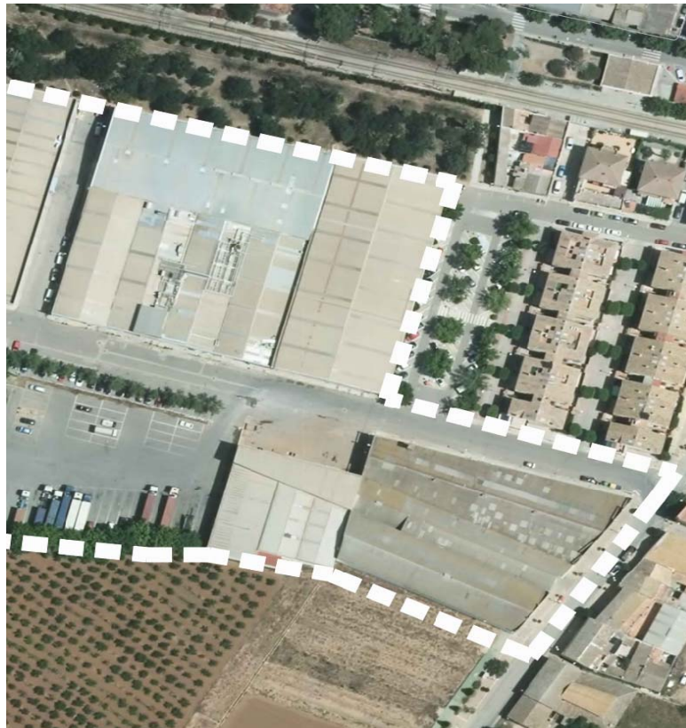
DELIMITACIÓN POLIGONO INDUSTRIAL TARONJA