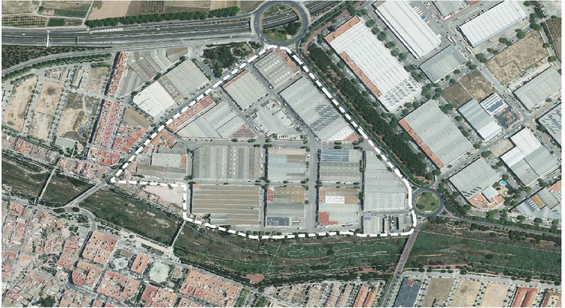
DELIMITACIÓN POLÍGONO INDUSTRIAL ALQUERIA DE RAGA