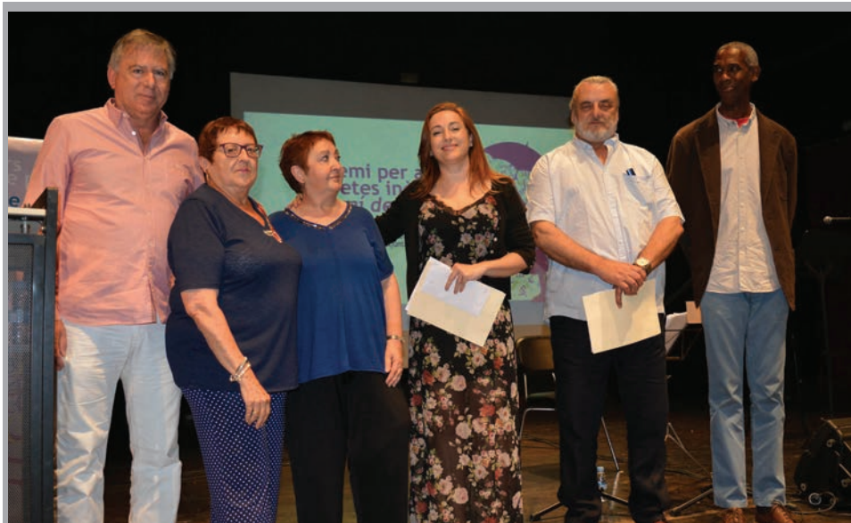
2017 - Lliurament de premis