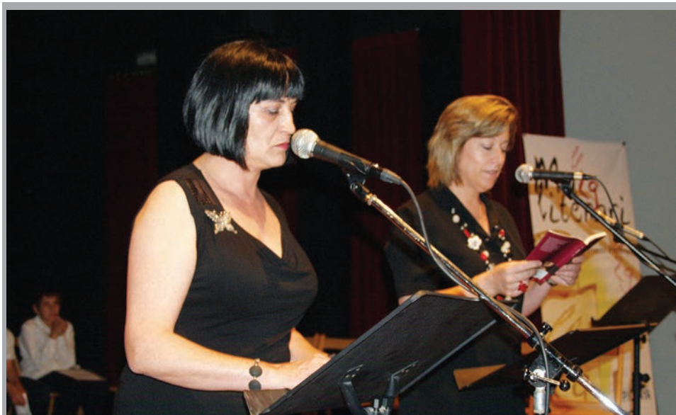
2011 - Lliurament de premis