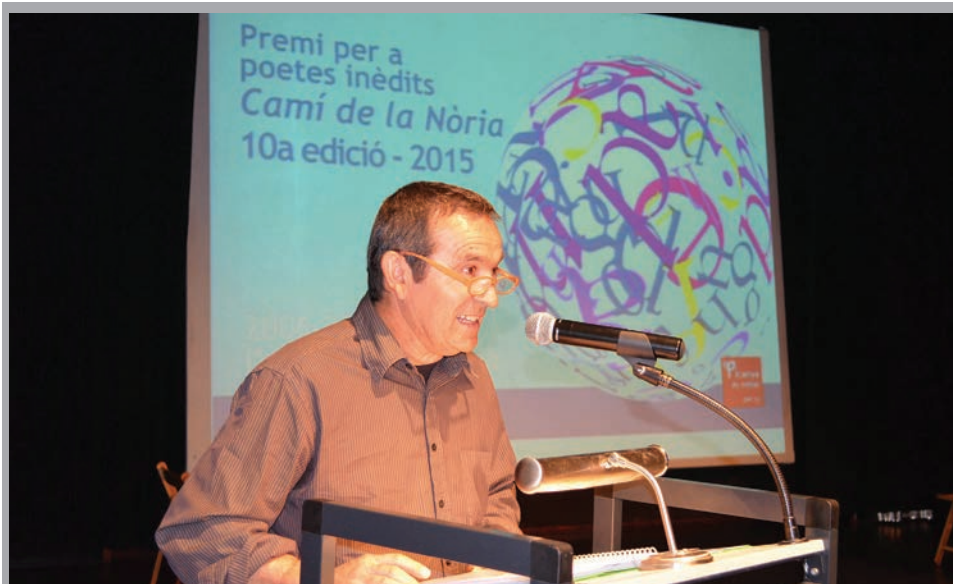
2015 - Lliurament de premis