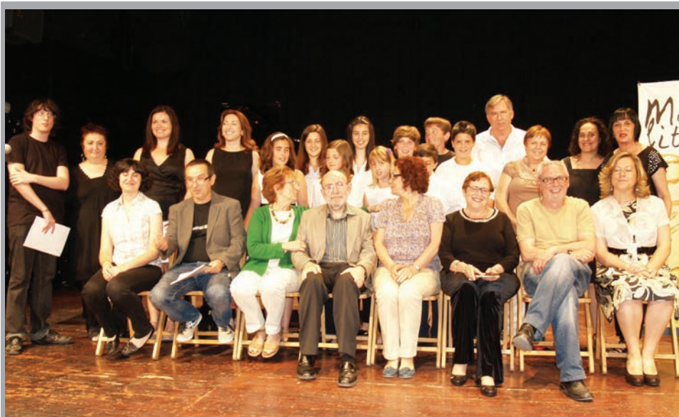
2012 - Lliurament de premis