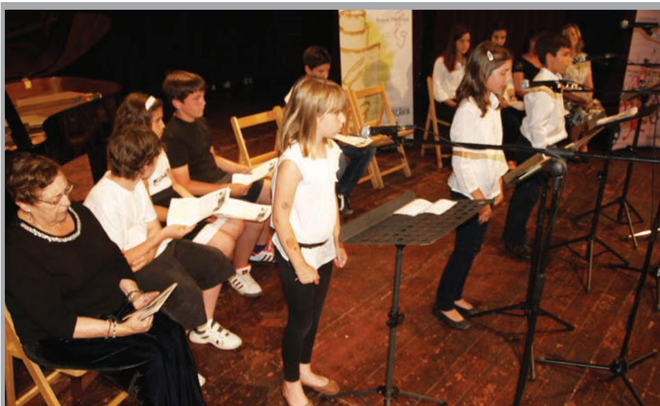
2012 - Lectura de poemes