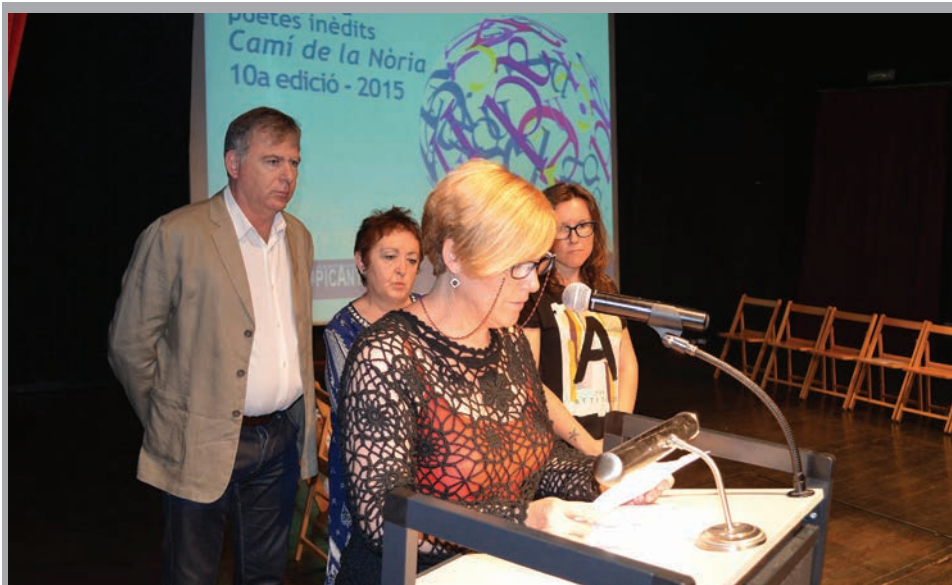
2015 - Lectura de l'acta