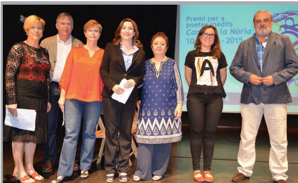
2015 - Lliurament de premis