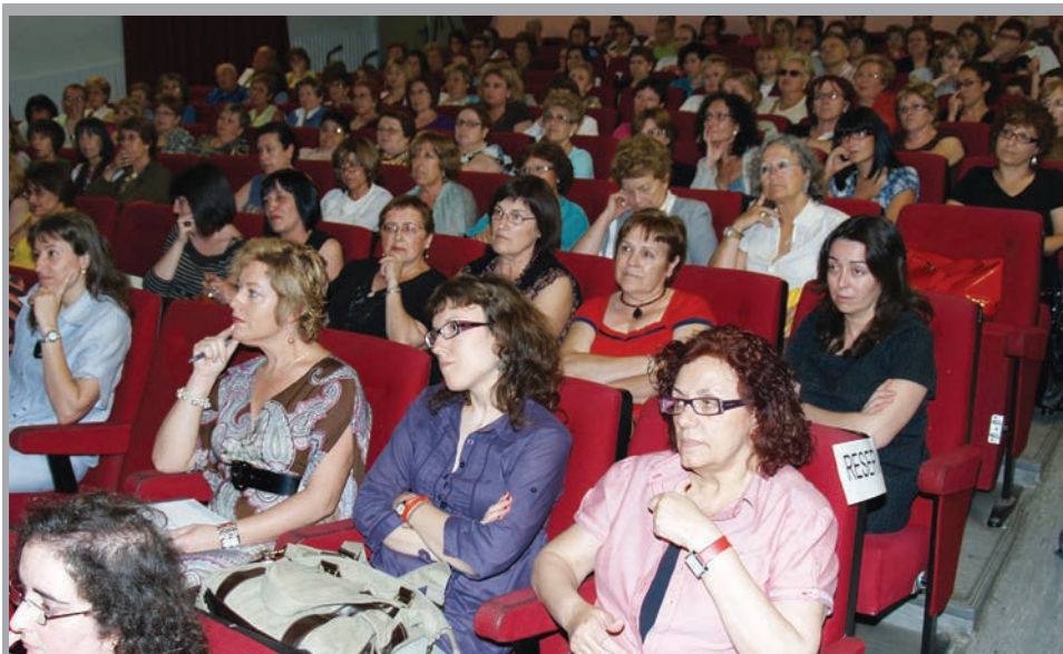
2009 - Lliurament de premis