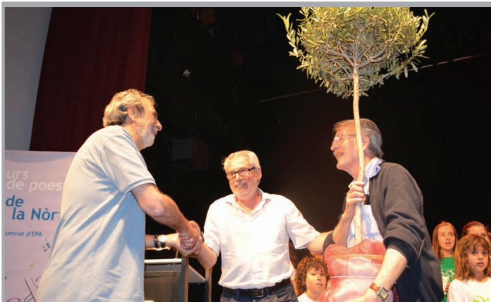
2014 - Homenatge a "Al Tall"