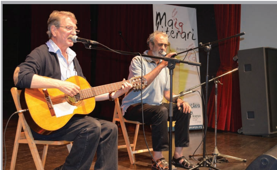
2014 - Actuació del grup "Al Tall"