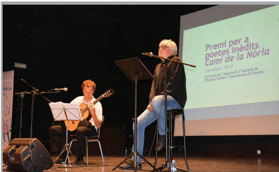
2017 - Actuació