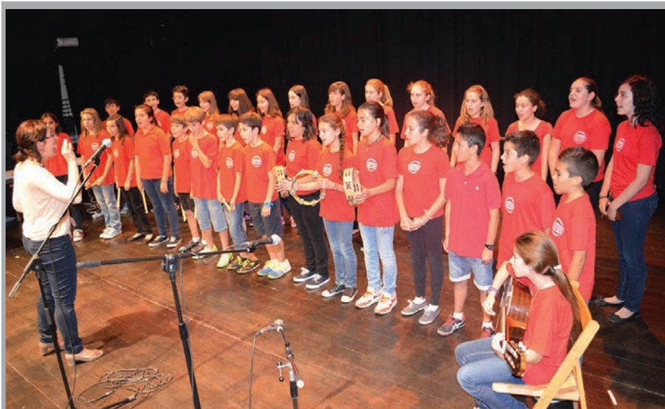
2014 - Actuació del Cor de l'Escola Baladre