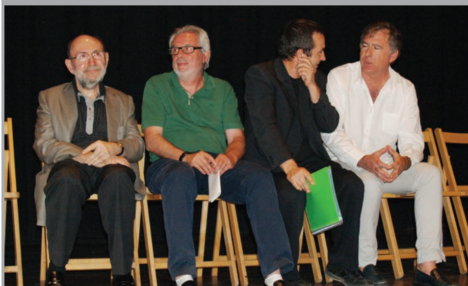
2011 - Lliurament de premis