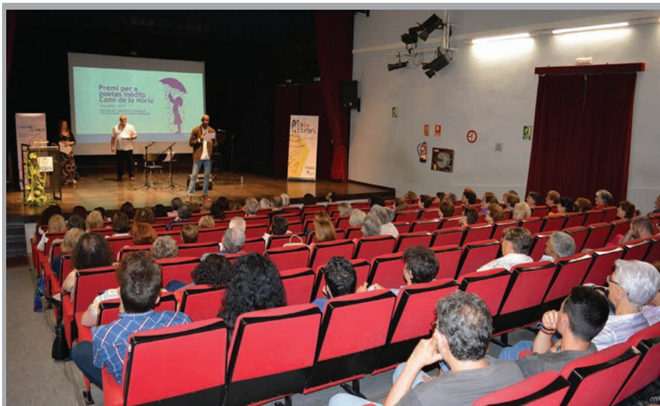
2017 - Lectura de poemes