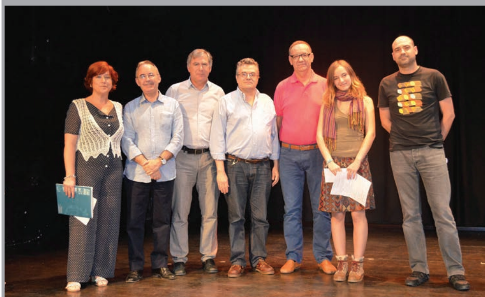
2014 - Lliurament de premis