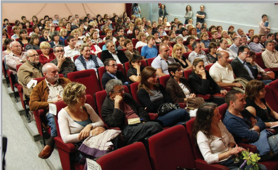
2008 - Lliurament de premis