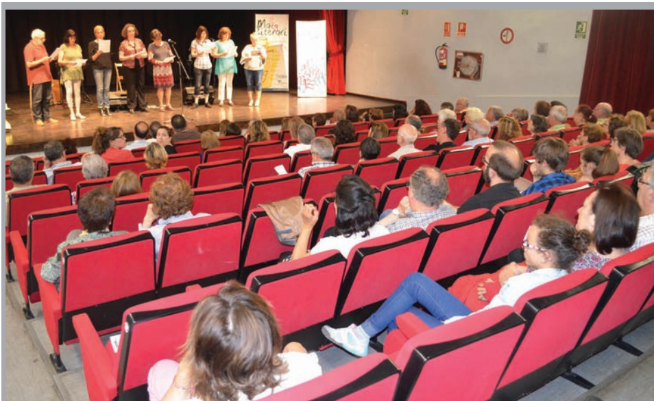
2016 - Lliurament de premis