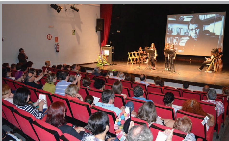
2015 - Homenatge a Ovidi Montllor