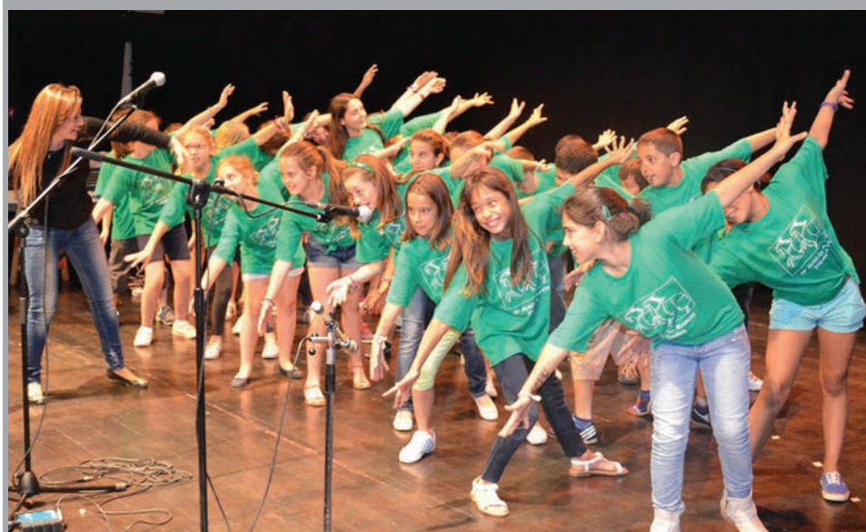
2014 - Actuació del Cor de l'Escola Ausiàs March