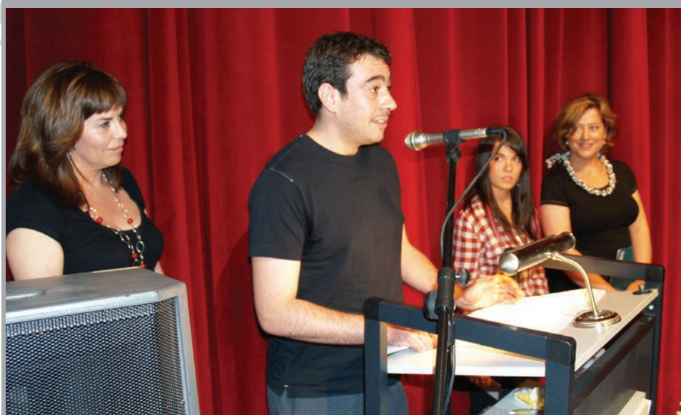
2008 - Lliurament de premis