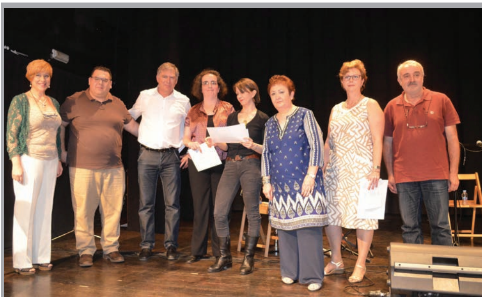
2016 - Lliurament de premis