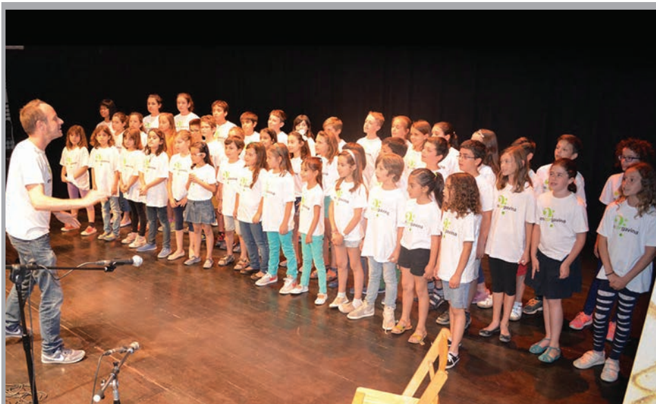
2014 - Actuació del Cor de l'Escola Gavina