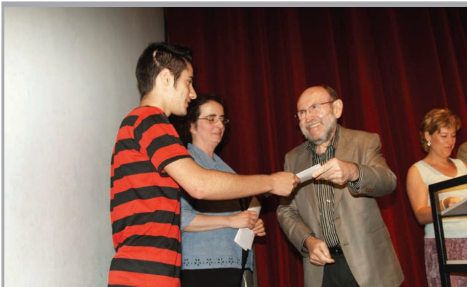
2010 - Lliurament de premis